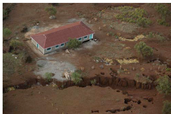
Dispensaire d'InterActions et failles d'érosion