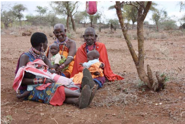
Un groupe de femmes âgées garde les enfants des mamans bénévoles.

Les bénévoles sont inscrits sur une liste remise à jour hebdomadairement. Ils se signalent dès l'entrée du site aux deux personnes, également bénévoles, en charge de la tenue à jour des registres.