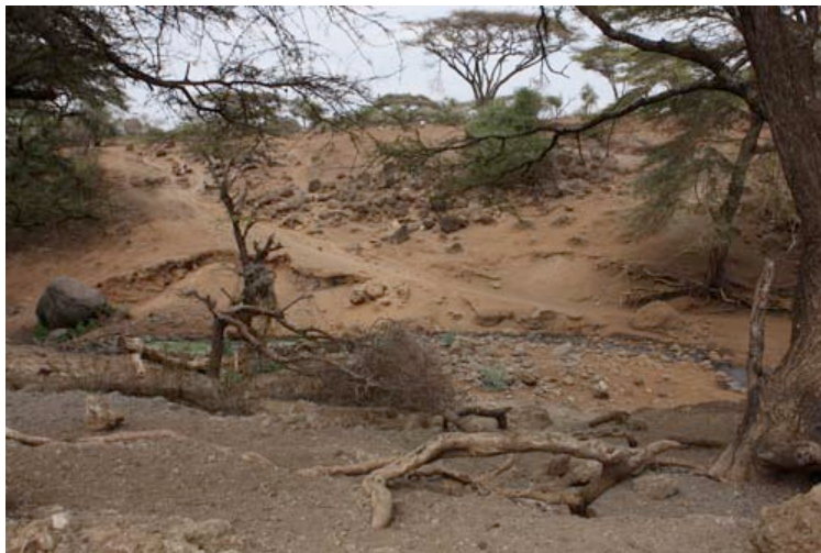
Le point d'eau où s'abreuvent les animaux, sauvages et domestiques, et les humains, est quasiment sec. Normalement, la rivière a entre 50cm et 2m de profondeur, sur environ 200m.

Les personnes vivant loin des programmes d'InterActions/WFE (où l'accès à l'eau potable est fourni en quantité et en qualité) ont commencé à venir sur la zone d'InterActions/WFE afin d'accéder à la disponibilité de l'eau.