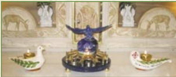
Lampes de la Paix: Modèles «Lampe Traditionnelle» et «Colombe»