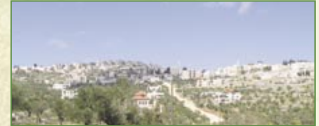
L'initiative vise tout particulièrement à enrayer l'émigration massive dont souffre Taybeh.

Sur les 3400 habitants d'il y a 30 ans, il n'en reste aujourd'hui plus que 1500 à Taybeh.