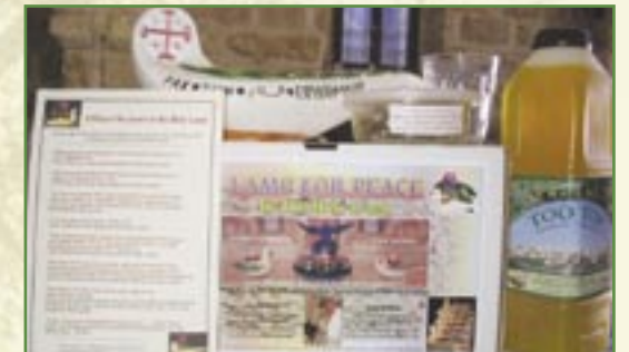
Contenu des kits de «lampes de la Paix»

Malgré l'attachement des villageois à leur Terre, ceux-ci sont poussés à tenter leur chance ailleurs, du fait des difficultés liées au conflit israélo-palestinien et du fait du manque de perspectives d'avenir.